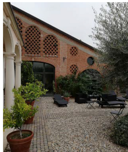
RIQUALIFICAZIONE DI UN CASCINALE NELL'OLTREPO PAVESE

Leonitek tiene ad evidenziare un forte approccio empatico con i clienti. "Per noi - conclude l'ingegnere - gli aspetti fondamentali per un progetto ben riuscito sono uno studio iniziale approfondito e le relazioni di fiducia che si creano con il committente; ciò ci permette di immedesimarci al meglio con l'utente che vivrà i luoghi da noi riqualficati con grande passione". ●